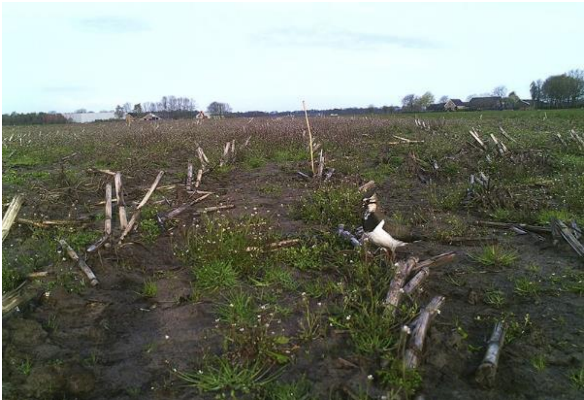
Kievit op bouwland met uitgesteld zaaien, fragment

Contact met veldmedewerkers en/of vrijwilligers is erg belangrijk. Zij brengen de nesten en kuikens in kaart, waarbij zoveel mogelijk vanaf de rand van het perceel gemonitord wordt. Nesten worden geregistreerd, het liefst digitaal. Nesten worden beschermd tegen verstoring via nestbeschermers of via uitstellen van zaaien van het gewas.