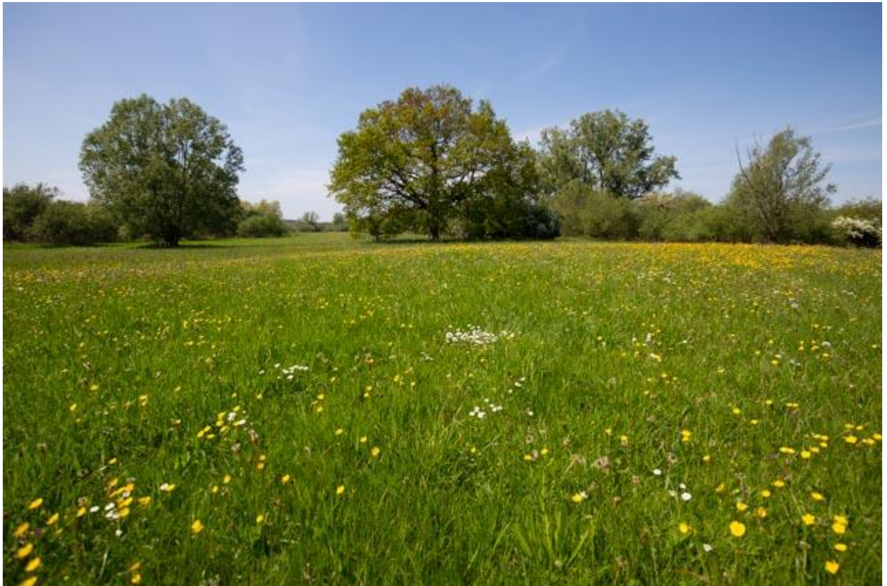
Botanisch grasland

Doelsoorten van de leefgebieden droge dooradering en open grasland waarvoor botanisch grasland meerwaarde heeft, onder andere: graspieper, patrijs, veldleeuwerik. Ook de kwartelkoning maakt gebruik van deze graslanden. Deze vogel broedt van ca. mei tot augustus, daarom is een rustperiode vanaf medio juni tot later in de zomer gewenst, dit kan via de pakketvarianten met rustperiode.