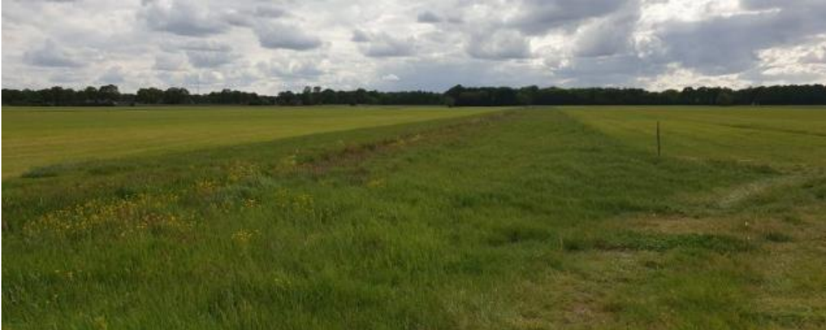
Kuikenveld: strook niet gemaaid gras

De vergoeding voor dit last-minute beheer met uitgesteld maaien begint te lopen vanaf 16 mei. Kuikenvelden worden bij voorkeur beheerd als vervolg op legselbeheer op grasland, registreer ze dan onder pakket 4 – Legselbeheer.