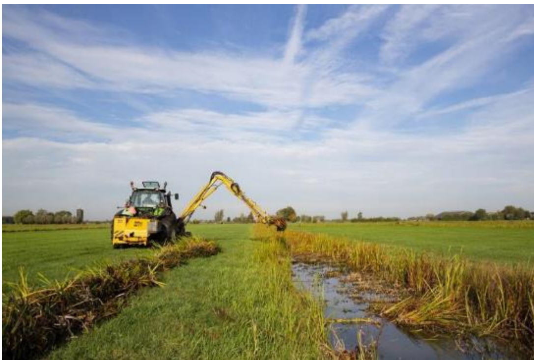
Ecologisch slootschonen

Baggerspuiten is bedoeld om delen van de sloot op diepte te houden. In dit beheerpakket moet dat met de baggerpomp, niet met de maaikorf, omdat dan de bodemvegetatie te veel beschadigd wordt.