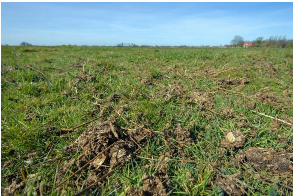
Ruige mest

c In pakketten t.b.v. bodemkwaliteit, water en klimaat is bemesting met ruige mest of andere bodemverbeteraars en plantenresten mogelijk via het pakket Bodemverbetering (pakket 39).