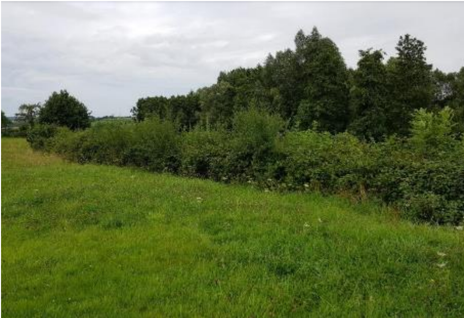
Struweelrand langs struweel

Door het extensieve beheer van deze randen is er veel rust en dekking. Bloeiende ruigtekruiden trekken veel insecten en daarmee vogels. Solitaire struiken zijn voor vogels ideale uitkijk- en zangposten en bieden nestgelegenheid.