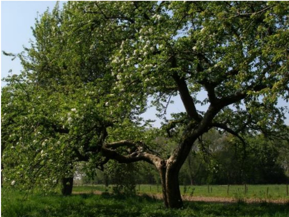
Oude appelboom in hoogstamboomgaard (foto https://www.brabantslandschap.nl/assets/Uploads/GallerijFotos/_resampled/ScaleWidthWyl4MDAiXQ/Oude-appelboom.JPG )

Boomgaarden passen in het leefgebied Dooradering. Voorbeelden van doelsoorten zijn Gekraagde roodstaart, houtduif, kerkuil, spotvogel, steenuil en ingekorven vleermuis. Dit pakket kan worden afgesloten in hoogstamboomgaarden en halfstamboomgaarden.