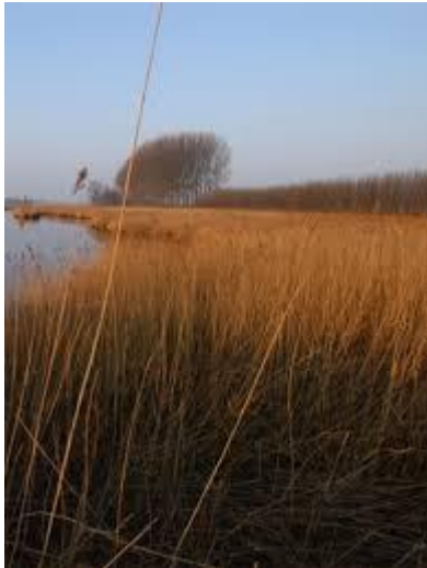
Rietzoom (Poldernatuur Zeeland)

Rietzomen zijn landschapselementen die bestaan uit smalle rietstroken die grenzen aan agrarisch gebruikte percelen. Vanwege een extensief gebruik zijn ze een belangrijk broedgebied voor rietvogels en daarnaast zijn ze van belang voor amfibieën, de ringslang, libellen en moerasvegetaties.