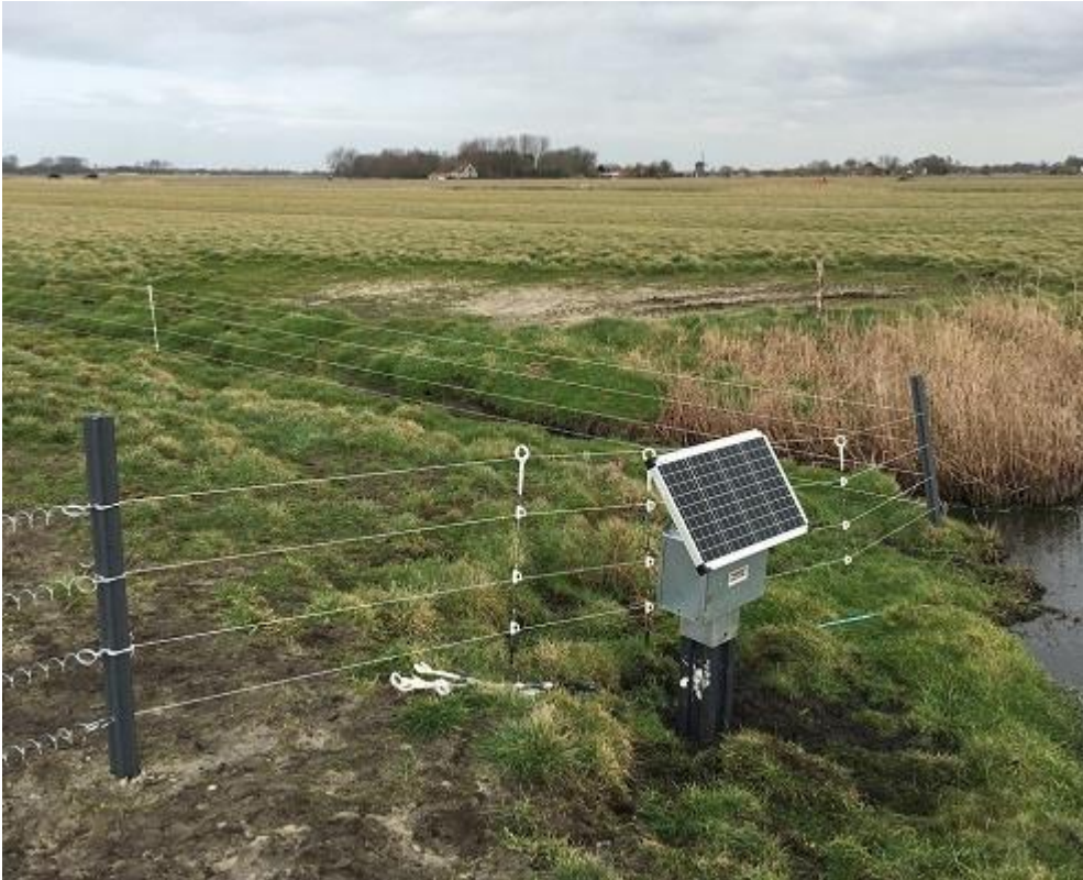
Vossenraster, collectief Water, Land en Dijken

Predatierasters om grondpredatoren te weren moeten worden onderhouden: gras onder het raster wegmaaien en het raster controleren op draden en spanning. Rasters staan veelal om een aantal beheereenheden met weidevogelmaatregelen geplaatst. De vergoeding voor het pakket betreft het plaatsen, onderhouden en weer verwijderen van het raster. Het is belangrijk je goed te laten informeren over het type raster, de plaatsing en het onderhoud zodat het past bij het mozaïek en de doelsoorten. Het (onderhoud van het) raster mag de rust op het perceel niet verstoren.