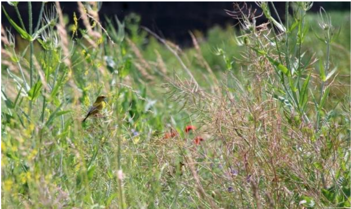
Bloemenblok in de zomer

Bloemenblokken bieden voedsel, veiligheid en voortplantingshabitat. Vogels vinden er veilige broedgelegenheid en voedsel voor kuikens. Patrijzenkuikens en jongen van andere boerenlandvogels eten in de eerste twee weken van hun leven voornamelijk insecten. Dit eiwitrijke voedsel is essentieel voor de groei van kuikens. Daarnaast is er volop zaad te vinden in de herfst en winter én bladgroen aan het einde van de winter als de zaden op raken. Bovendien biedt de begroeiing dekking tegen predatoren en slechte weersomstandigheden. Naast patrijzen zijn er nog vele andere vogelsoorten die van een bloemenblok kunnen profiteren. Ook vlinders, bijen en hommels profiteren van het grote aanbod van bloemen.