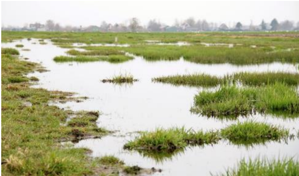
Plas dras in Krimpenerwaard (foto https://www.hetkontakt.nl/regio/krimpenerwaard/191048/steeds-meer-plasdraspompen-in-krimpenerwaard )

Het pakket met startdatum 15 februari heeft als voordeel dat de plasdras aanwezig is bij de start van het weidevogelseizoen, het pakket met startdatum 1 maart biedt een langere tijd voor de ontwikkeling van de bodemfauna. De plasdrassen in de periode mei-augustus hebben een functie als opvethabitat voor de vogels. De plasdras in november-december is bedoeld voor overwinterende soorten zoals de Kleine zwaan.