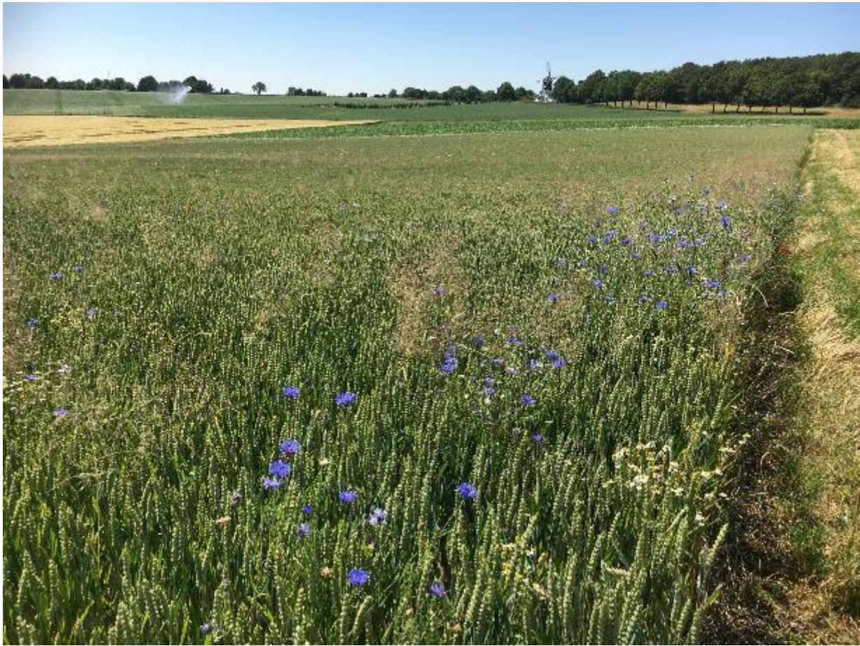
Hamstervriendelijk graan

Voor hamsters is het van belang dat er voedsel, veiligheid en dekking in de winter is. Dat kan door op bouwland graan en luzerne te telen. Een deel van de percelen mag worden geoogst, maar op hamstervriendelijke wijze.