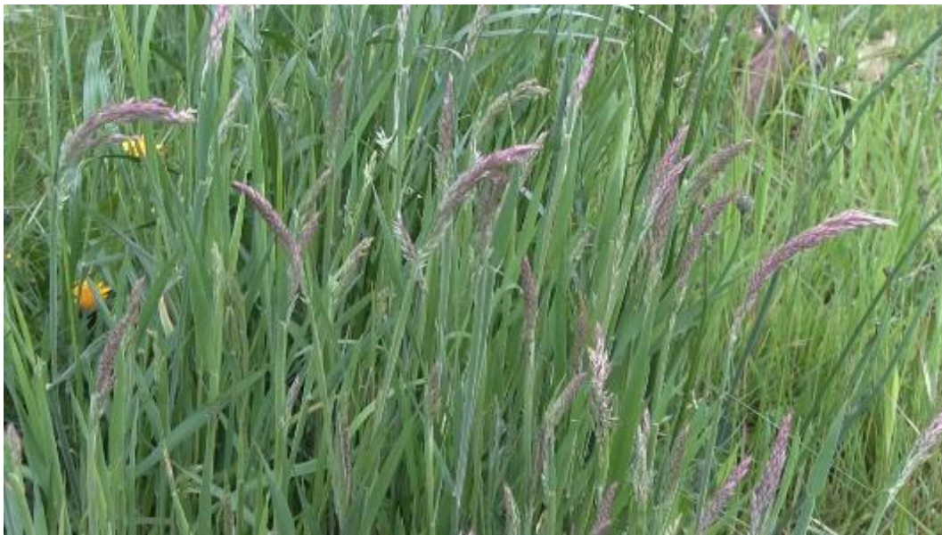
Witbol domineert hier de vegetatie, terugdringen door tweede helft mei te maaien

Dit pakket is bedoeld voor percelen waar je (extensief) kruidenrijk grasland wilt ontwikkelen, maar die nu nog zeer soortenarm zijn. Deze percelen worden bijvoorbeeld gedomineerd door witbol of bestaan nog geheel uit Engels raaigras. Verschralen van de bodem bevordert de kruidenrijkdom, dat wil zeggen dat er niet wordt bemest, er geen bagger wordt opgebracht en het maaisel wordt afgevoerd. Ook door beweiding achterwege te laten, voorkom je bemesting van het perceel en zorg je voor een snellere verschraling van het perceel. Vroeg maaien is van belang om het dominantiestadium van witbol te doorbreken, dan wel om zoveel mogelijk voedingsstoffen af te voeren. Omdat de eerste snede in het broedseizoen is, zal er naar nesten gezocht moeten worden.