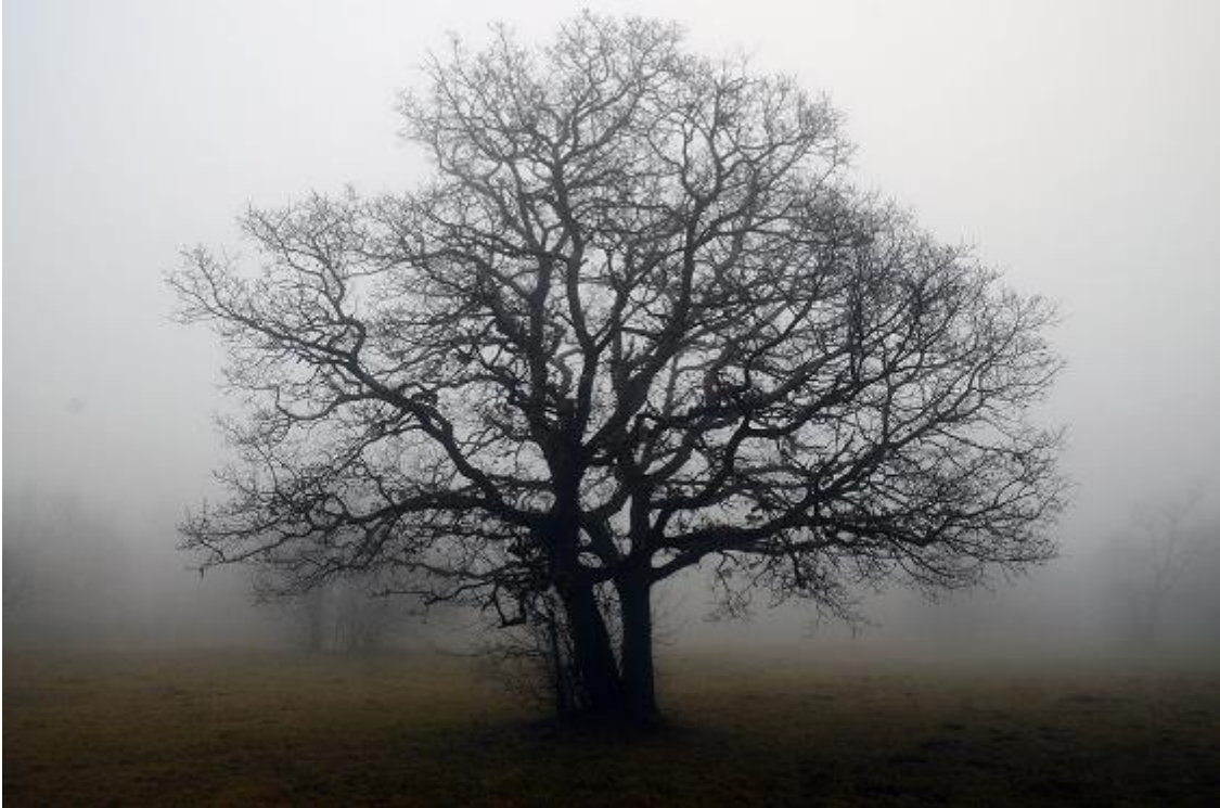
Solitaire boom ( https://www.landschapsfondshollandrijnland.nl/solitaire-boom/ )

Het verschil met beheerpakket 21 ( Beheer van bomenrijen ) is dat dit pakket kan overlappen met landbouwgrond. Beheerpakket 21 is een landschapspakket. Qua beheer lijken de pakketten wel sterk op elkaar.