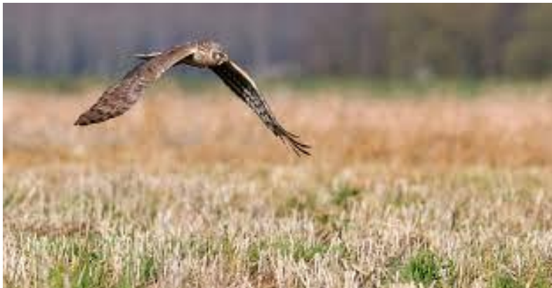
Graanstoppel met Blauwe Kiekendief

Stoppel, met name hoge stoppel, is waardevol voor akkervogels, zeker in combinatie met andere vormen van akkervogelbeheer in de omgeving. Akkervogels vinden hierin dekking én voedsel in de winter. Als stoppel of gewasresten door de winter ongestoord kan blijven liggen is dat heel aantrekkelijk voor zaadeters als veldleeuwerik, patrijs, geelgors en kneu, maar ook voor muizeneters als torenvalk, blauwe kiekendief en uilen. Een graanstoppel die tot en met het volgende groeiseizoen blijft liggen, biedt daar bovenop opgroei en foerageergelegenheid voor akkervogels.