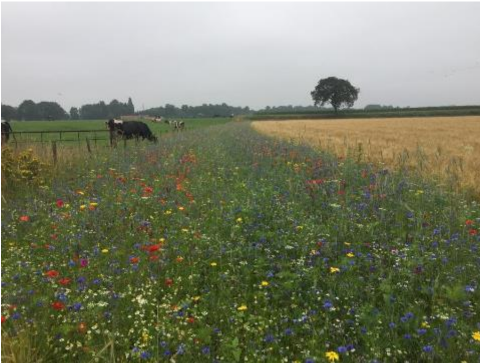
Kruidenrijke akkerrand

In akkerranden wordt geen gewas geteeld. Ze zijn ingezaaid met een mengsel van grassen, kruiden en granen. Ze worden niet bemest en niet bespoten (uitgezonderd pleksgewijs). Akkerranden brengen het mozaïekpatroon terug in het cultuurlandschap en zijn positief voor akkervogels. Vanwege de geringere bodemverstoring en de grotere bufferwerking boeken brede, meerjarige akkerranden meer natuurresultaat dan smalle, eenjarige randen.