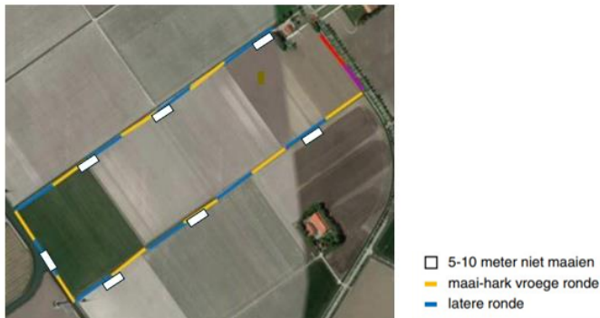
Voorbeeld van maairegime: maatwerk op basis van lokale situatie én in overleg met de ondernemer.