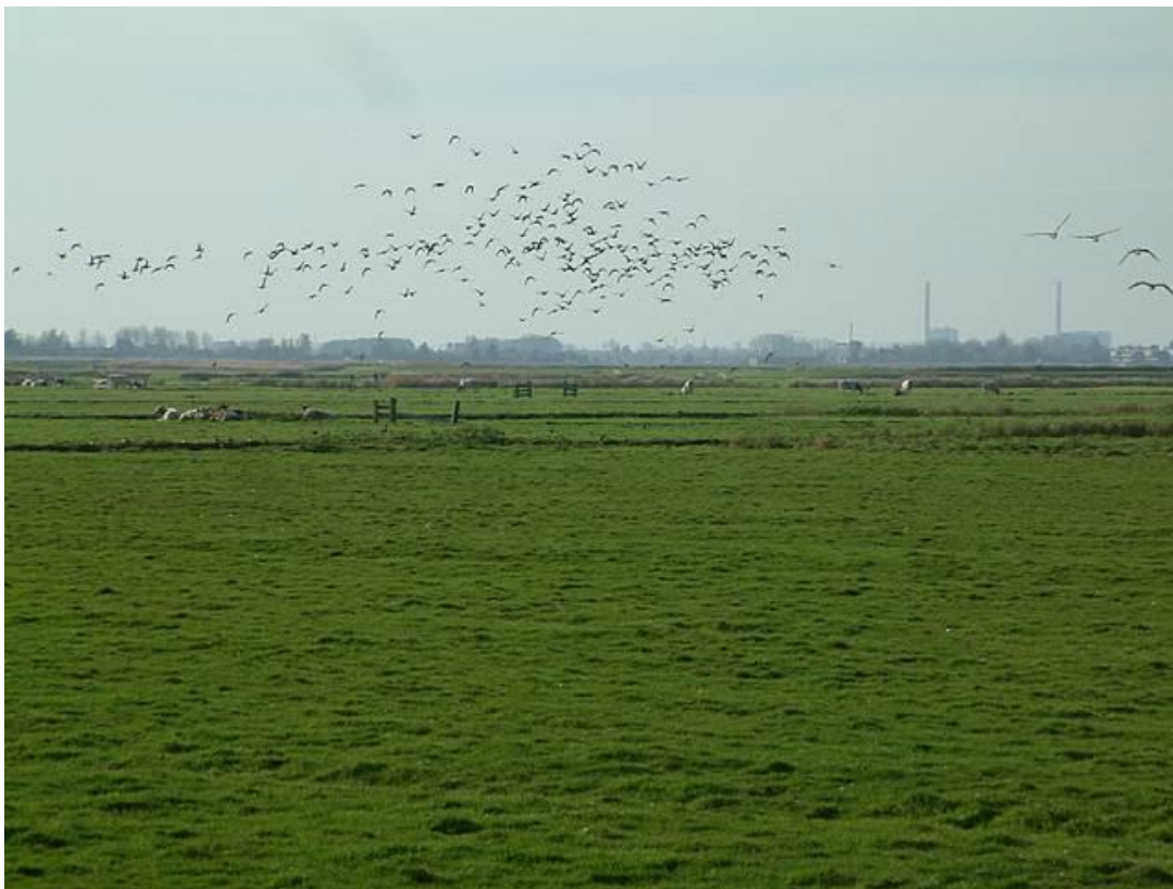
Weidevogellandschap ( https://nl.wikipedia.org/wiki/Weidevogel )

Voor kieviten zijn een aantal pakketten met een vroegere rustperiode geschikt (vanaf 15 maart), de rustperiode loopt voor kieviten ook eerder af, uiteraard alleen als er geen opgroeiende kuikens, ook niet van andere soorten, aanwezig zijn.