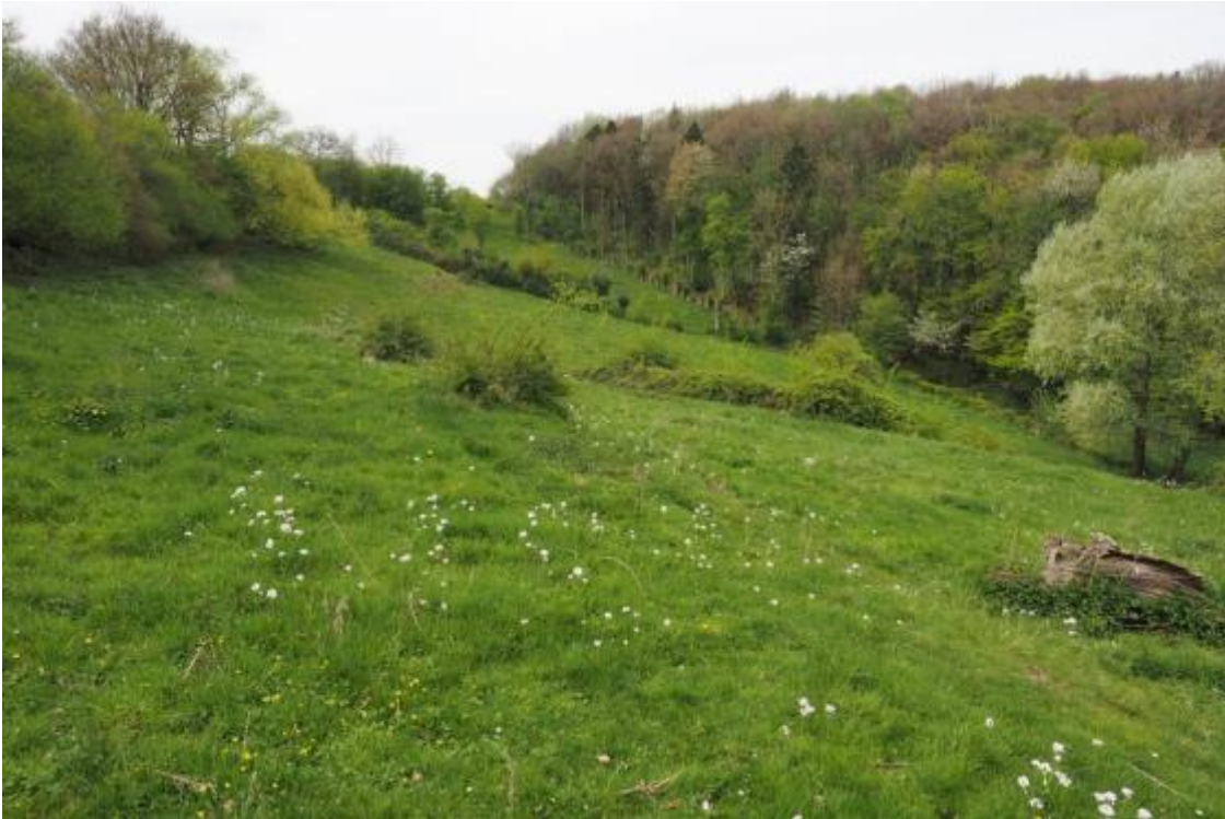
Grasland in Limburg ( https://www.naturetoday.com/intl/nl/nature-reports/message/?msg=23618 )

Dit pakket kan worden ingezet op graslanden met daarin de kensoort Grote pimpernel (in Limburg). Ook zijn er in deze graslanden veel mierennesten aanwezig (zoals knooppieren, gewone steekmier en moerassteekmier).