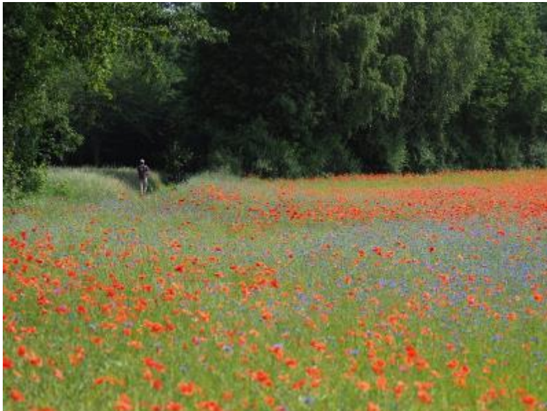
Foto Florarijke akker

De granen dragen ook bij aan doelstelling klimaat. Doordat granen diepe wortels hebben, dragen ze bij aan een bodemstructuur die zorgt voor goede doorlatendheid voor water. Tevens hebben diezelfde wortels ook een gunstig effect op de hoeveelheid koolstof in de bodem.