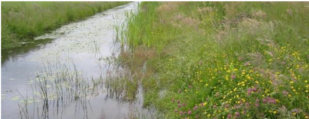
Natuurvriendelijke oever

Natuurvriendelijke oevers beschermen tegen afkalven van de oever. Door, bijvoorbeeld, drinkbakken te plaatsen, voorkom je vertrapping van de oever door vee. Dat helpt om te voorkomen dat veen 'weglekt' naar de sloot en wordt extra slibvorming voorkomen. Slib in veensloten is een belangrijke bron van methaanuitstoot. Natuurvriendelijke oevers dragen daardoor bij aan klimaatmitigatie omdat slibvorming en daarmee methaanuitstoot voorkomen wordt.