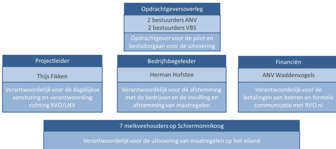
Figuur 2 – Projectorganisatie pilot Biodivers boeren op Schiermonnikoog

De projectorganisatie komt samen in verschillende overlegvormen. Deze zijn toegelicht in het gebiedsplan. Een uitgebreider overzicht van samenwerkingsafspraken is opgenomen in de samenwerkingsovereenkomst van de pilot.