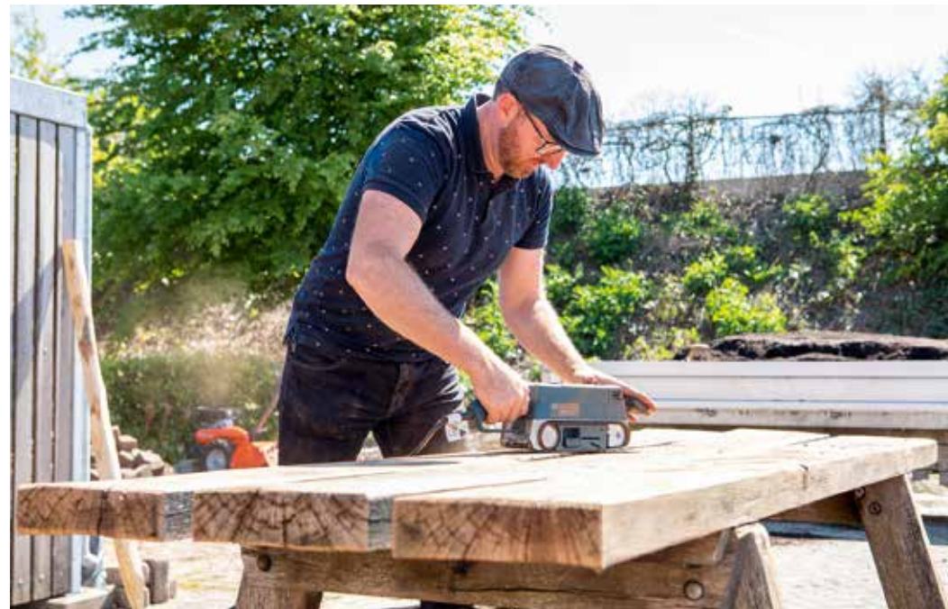
Werken aan onze natuurinclusieve tuin te Goor.

'Samen bespreken we: waar loop je warm voor, welke doelen en acties passen daarbij en hoe vallen de ambities samen met die van Eelerwoude? Daarvoor hebben we het traject "doelgericht werken" opgezet. Dit bestaat uit drie