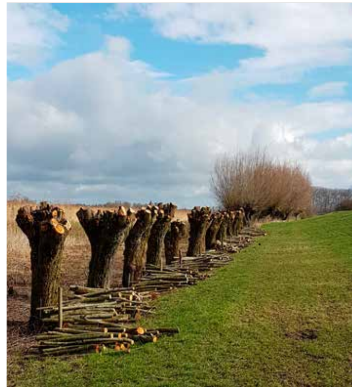
Een goed onderhouden cultuurlandschap, met dank aan de agrarische natuurverenigingen.