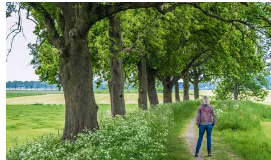
De nieuwe hollandse waterlinie