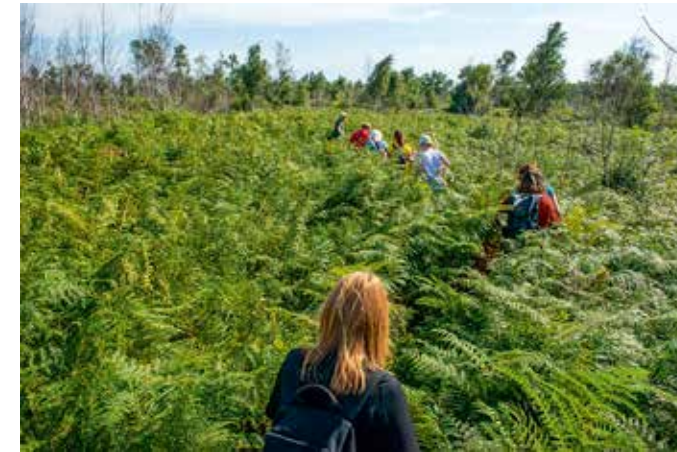
Lectoraat CoSPEL tijdens een veldbezoek aan het veenproject Peatland.

‘We hebben maar weinig fysieke labs in het gebouw. Onze labs zijn overal. Zo