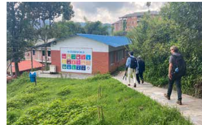
Studenten River Delta Development op excursie.

werken we veel met zogenaamde living labs, een bepaalde leeromgeving waarbinnen je onderzoek doet. Dat kan ons eigen landgoed zijn, waar onderzoek wordt gedaan naar bijvoorbeeld manieren om de waterstand in de bodem te reguleren of de mogelijkheden van voedselproductie in een voedselbos. Maar veelal zijn het plekken elders. Werken we samen met een waterschap, dan kan een bepaald riviertraject een living lab zijn. Bijvoorbeeld om de waterkwaliteit of overstromingsrisico's te bestuderen. Een living lab kan ook niet-fysiek zijn: een omgeving waarin we mensen interviewen over hun beleving van hittestress of het maatschappelijk debat over stikstof. Typisch voer voor het lectoraat CoPSEL, wat staat voor communicatie, participatie en sociaal-ecologisch leren. Dit lectoraat observeert wat mensen doen in een bepaalde omgeving, welke interventies er nodig zijn om mensen bij elkaar te krijgen en/of mee te krijgen. Het is heel belangrijk om studenten